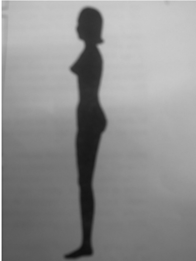
圖 1 女性身材側面剪影圖 (取自 Jones, 1996)